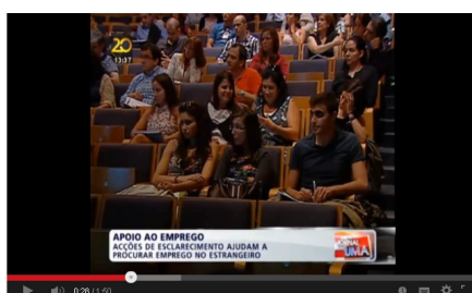
Volta de Apoio ao Emprego no Porto Jornal da Uma - TVI