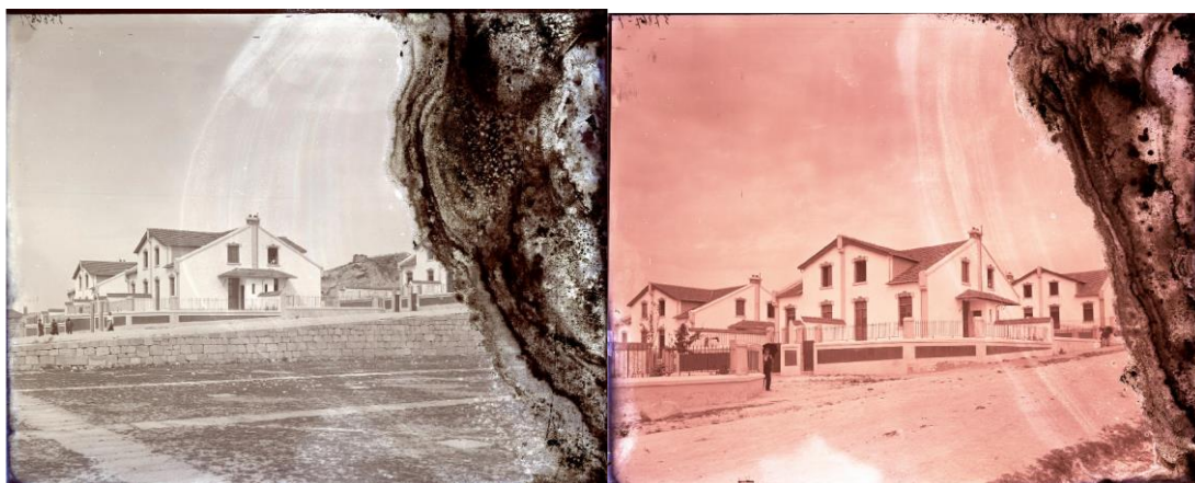
Fotos do Bairro tiradas do terreno do Quartel do Monte Pedral – Início do Sec. XX