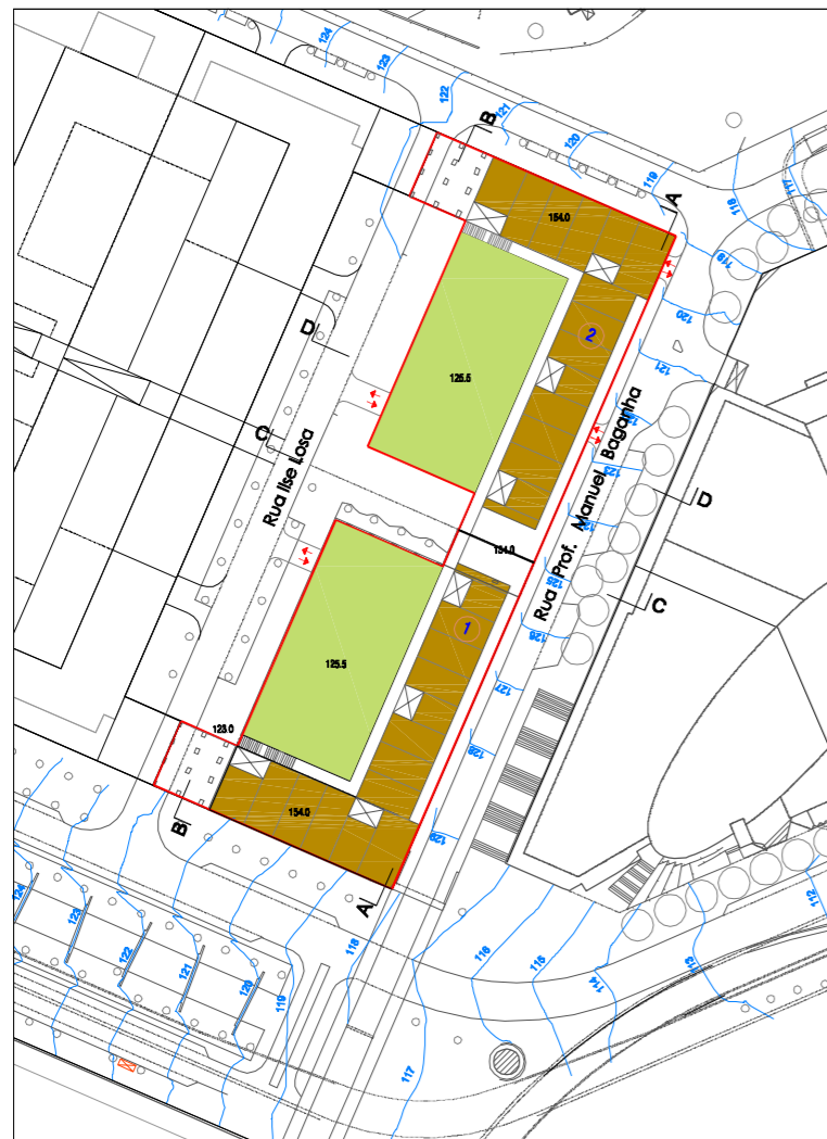
Planta cota - 154.00