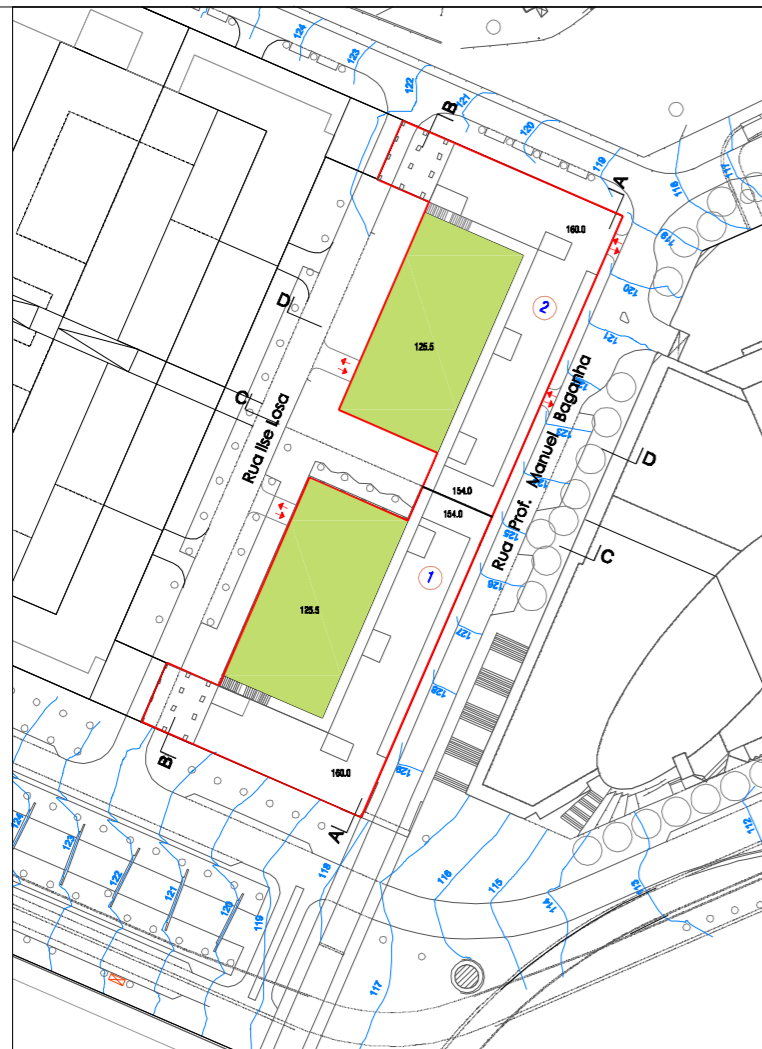
Planta cota - 160.00