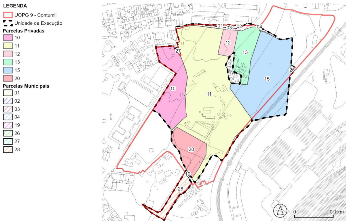
Figura 2. Planta Cadastral da UE