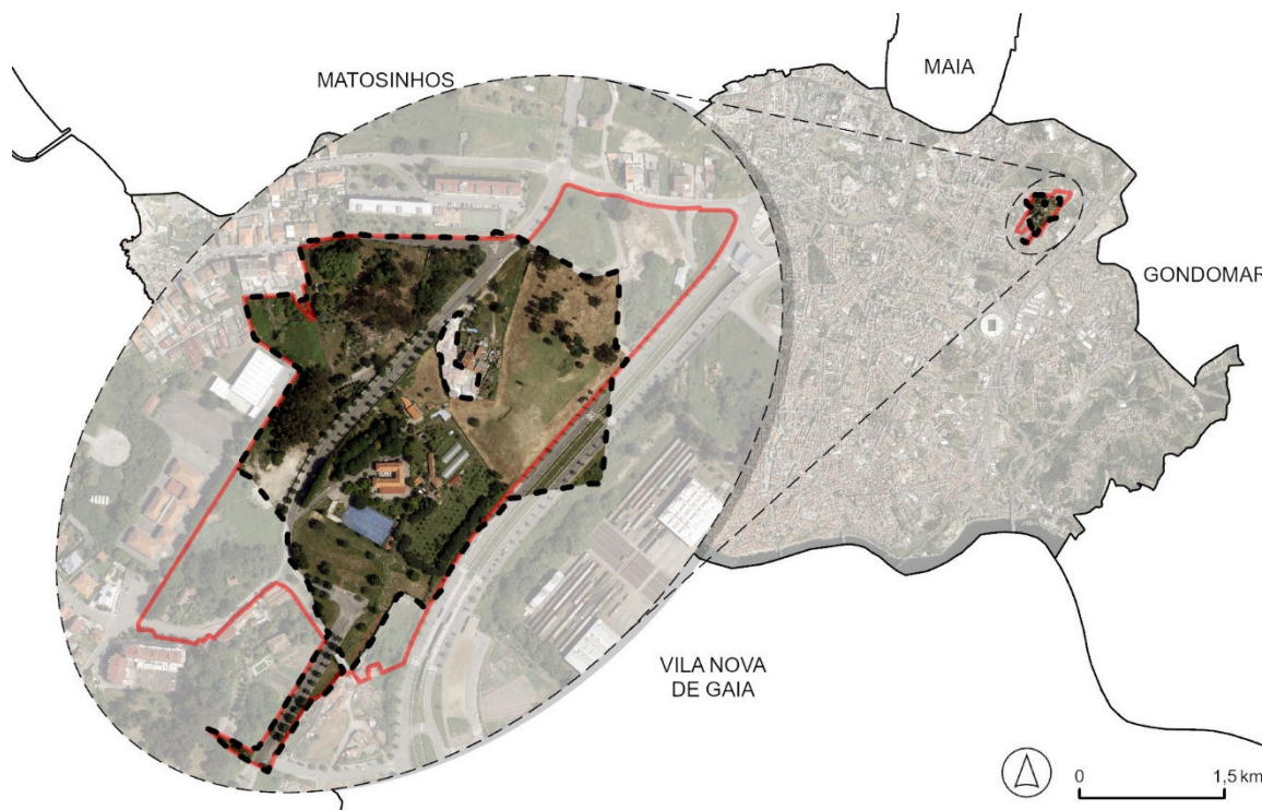
Figura 1. Planta de Localização da UE

A área objeto da proposta desta UE, corresponde a uma área de território com 97.822,05 m 2 , localizada na parte oriental-norte da cidade do Porto, sendo delimitada a norte pela Rua de Santo António de Contumil, a nascente pela Alameda da Cruz Vermelha Portuguesa, a sul pela Rua da Presa de Contumil e Rua João Paulo Seara Cardoso e a poente pela Escola Básica do 2.º e 3.º Ciclo Nicolau Nasoni – conforme delimitação constante na Planta de Localização ( Figura 1 ).