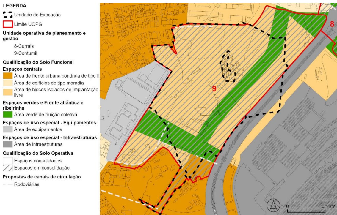
Figura 3. Extrato da Planta de Ordenamento - Carta de Qualificação do Solo

O PDMP apresenta um modelo territorial de referência para abordar as intervenções do território municipal e, nesse sentido, regula a área proposta para a Delimitação da UE tendo em atenção dois tipos de abordagem: uma de índole da qualificação operativa do solo; e outra de índole da qualificação funcional do solo. Na qualificação operativa do solo (Artigos 12.º e 13.º do RPDM), a área de intervenção para a UOPG 9 – Contumil, insere-se em “espaços em consolidação”. Quanto à qualificação funcional do solo, a área de intervenção integra as categorias de “Espaços Centrais” (Artigos 17.º e 18.º) nas subcategorias de “Área de frente urbana contínua tipo II” (Artigos 26.º a 28.º) e de “Área de blocos isolados de implantação livre” (Artigos 31.º a 33.º) e de “Espaços verdes e frente atlântica ribeirinha” na subcategoria de “Área verde de fruição coletiva” (Artigo 40.º) (Figura 3).