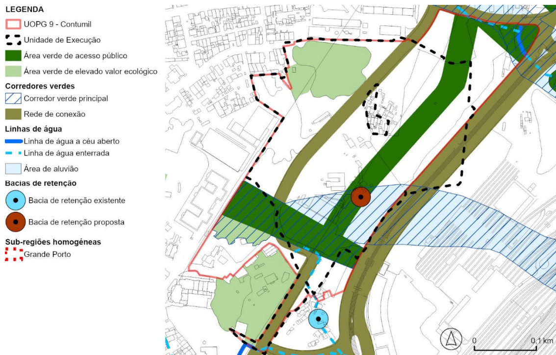
Figura 4. Extrato da Planta de Ordenamento - Carta da Estrutura Ecológica Municipal