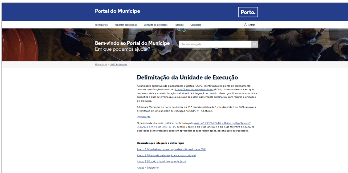
Figura 2: Divulgação no Portal do Município