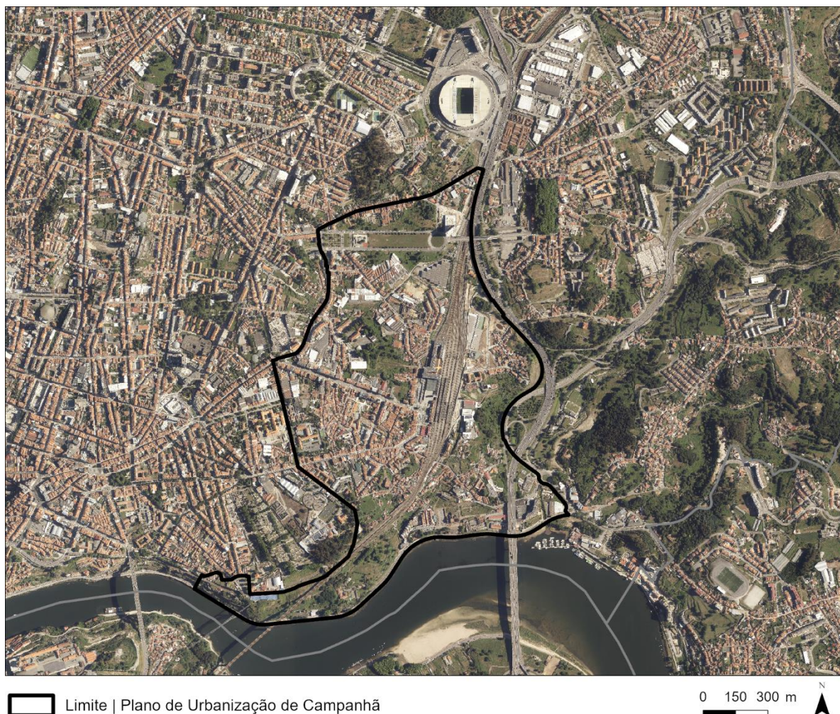
Figura 1. Área do Plano de Urbanização de Campanhã